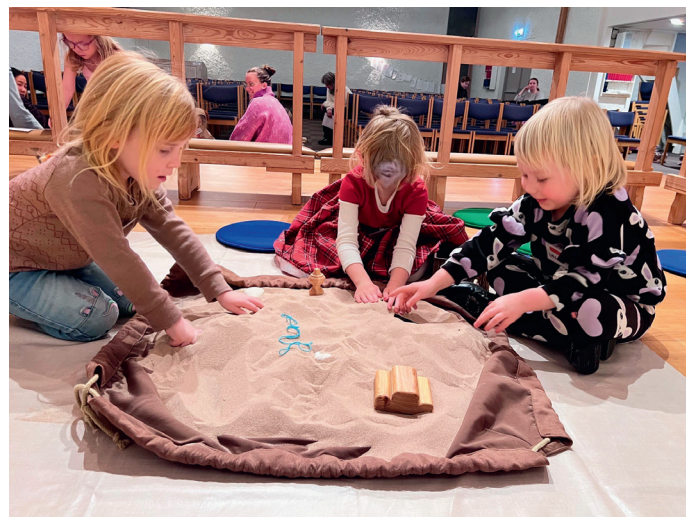
Full fart på 5-årsklubben i Langenes arbeidskirke.