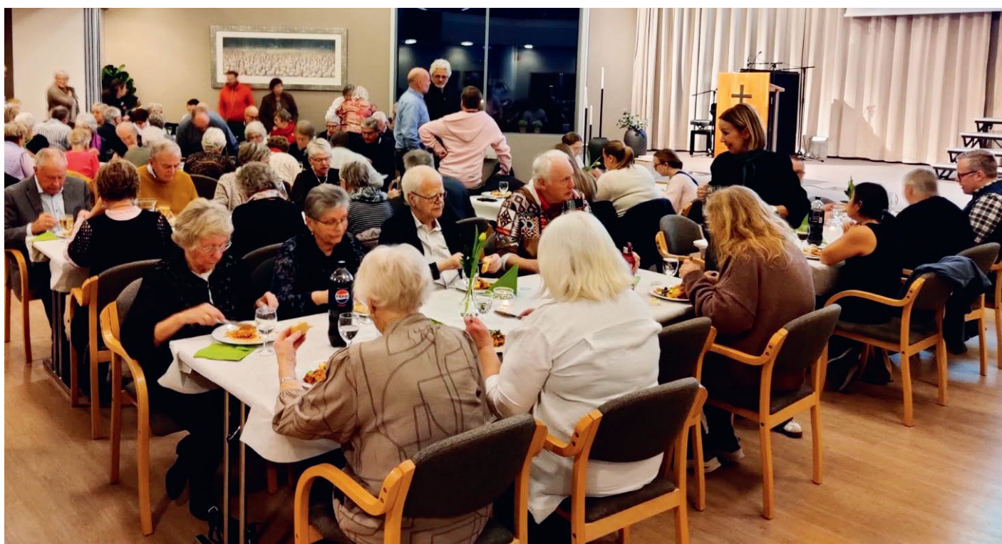
Mange frivillige stilte opp til en velfortjent takk.