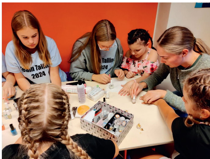
Fra misjonstur til Tallinn i 2024 hvor det ble arrangert mange hyggelige aktiviteter for barna på et barnehjem..

I Ogre vil vi besøke Tabitasenteret, et dag- og sosialsenter som drives av NOGE (Norsk organisasjon for gatebarn i Estland og Latvia) der barn og unge fra fattige familier i nærområdet kan komme etter skolen og i ferier. Senteret tilbyr et trygt oppholdssted, leksehjelp, et måltid mat, en dusj og hyggelige aktiviteter, samt trygg voksenkontakt.