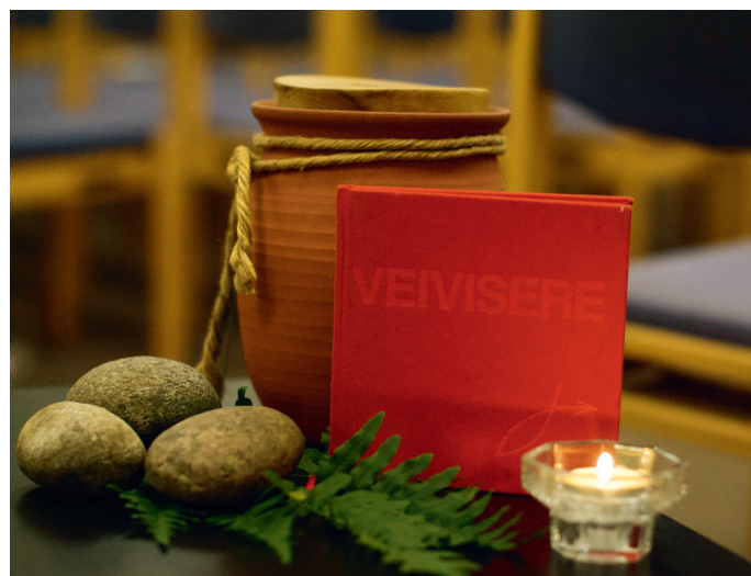
Velg en stein som symbol på noe du bærer på som du vil legge fra deg.

I samlingene er det også en bønnevandring, Da er det mulig å bevege seg rundt i kirkerommet til ulike stasjoner med ulike symboler, du kan gå dit du trenger eller vil. Og du kan sitte rolig i stillheten. Kanskje kan dette skje? Legge fra deg noe du bærer på, konkret og symbolsk. Finne en stein i kurven. Kjenne tyngden av steinen i håndflaten. Valgte du en rund og glatt, nesten myk? Eller plukket du opp en knudrete en som stikker litt mot huden? Uansett kan du holde den en stund, og når du er klar, bære den fram og legge den fra deg. Gi den til en som er