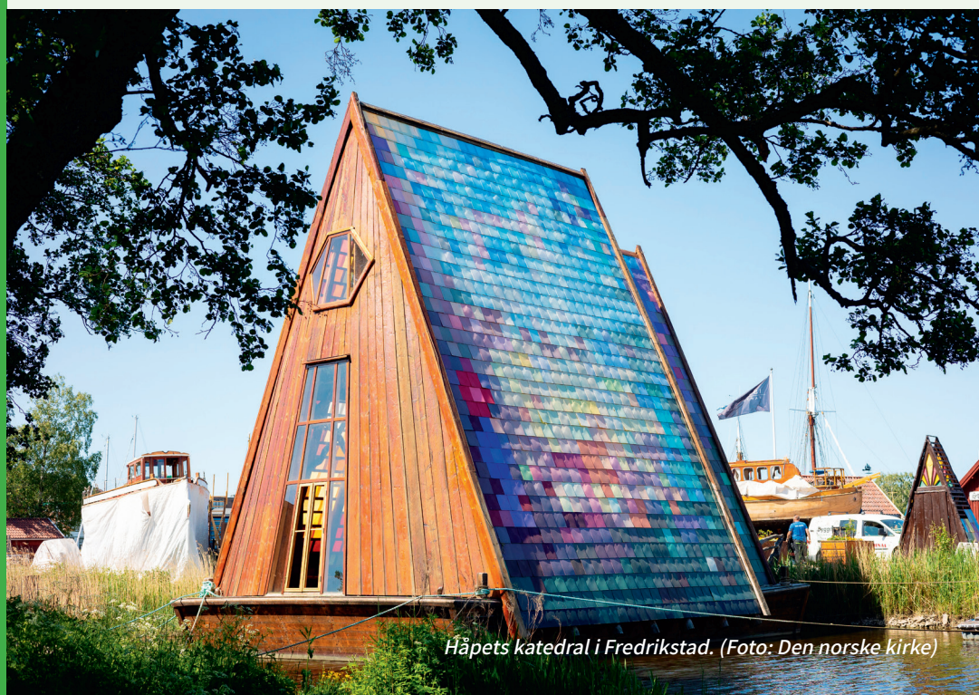
Håpets katedral i Fredrikstad.