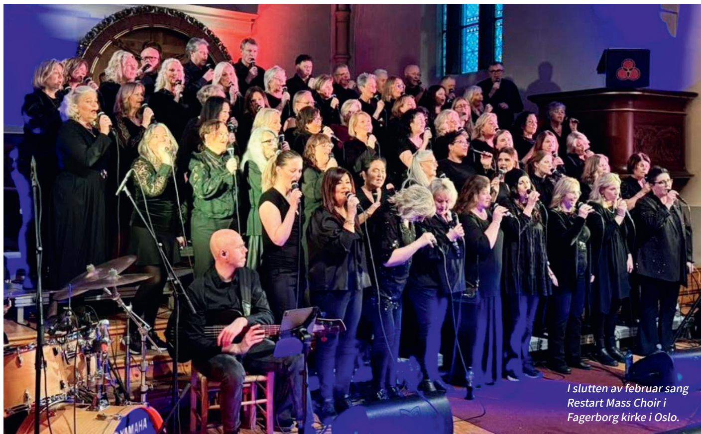
I slutten av februar sang Restart Mass Choir i Fagerborg kirke i Oslo.