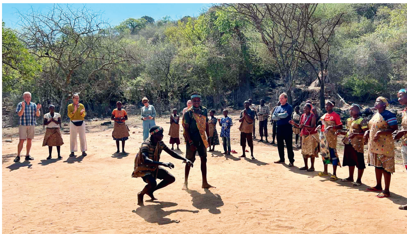
Danseoppvisning hos Hadzabe-stammen.