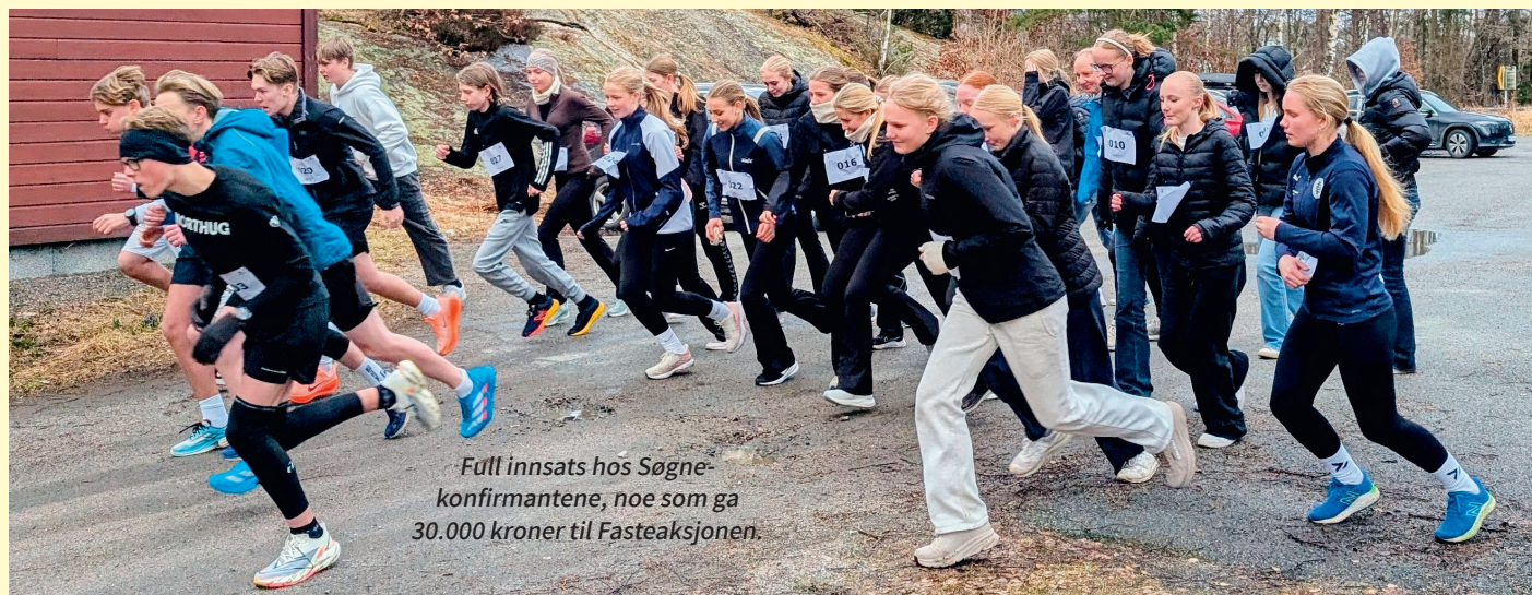
Full innsats hos Søgnekonfirmantene, noe som ga 30.000 kroner til Fasteaksjonen.

21.520 kroner mens Finlands 9 konfirmanter kunne notere seg for 19.993 kroner. Tallene for Greipstad og Finland inkluderer også kirkekollekten på aksjonsdagen.